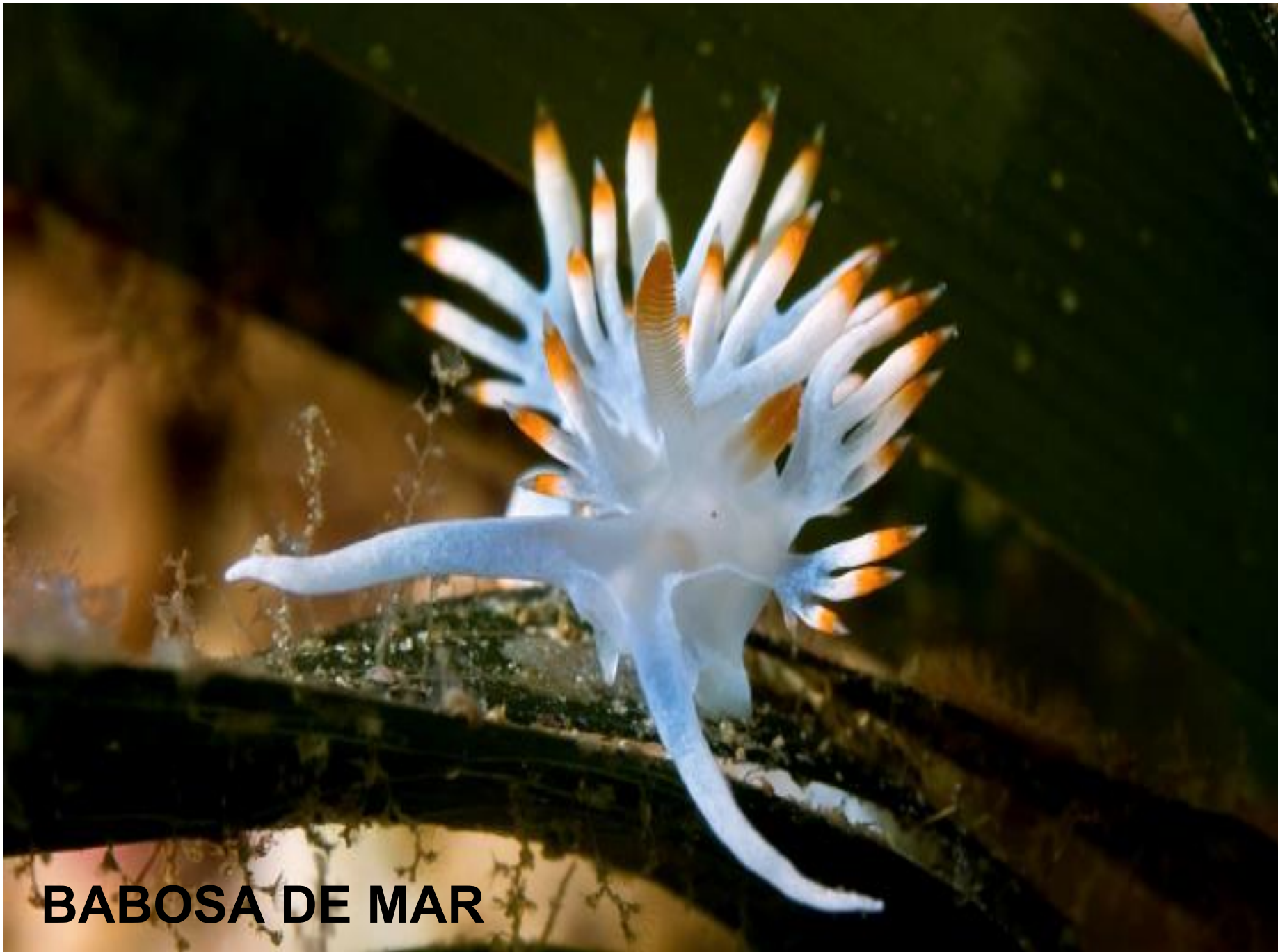
BABOSA DE MAR