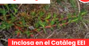
Ungla de gat