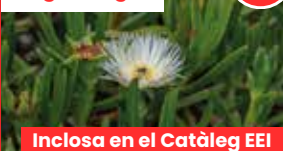
Ungla de gat

Les espècies exòtiques invasores (EEI) són una de les causes principals de pèrdua de biodiversitat en el món, i suposen una amenaça greu per als ecosistemes autòctons